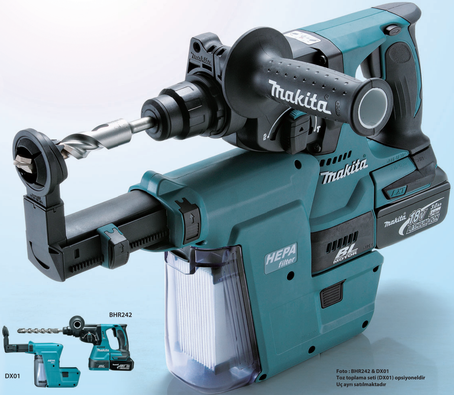
Foto : BHR242 & DX01 Toz toplama seti (DX01) opsiyoneldir U ayrı satılmaktadır